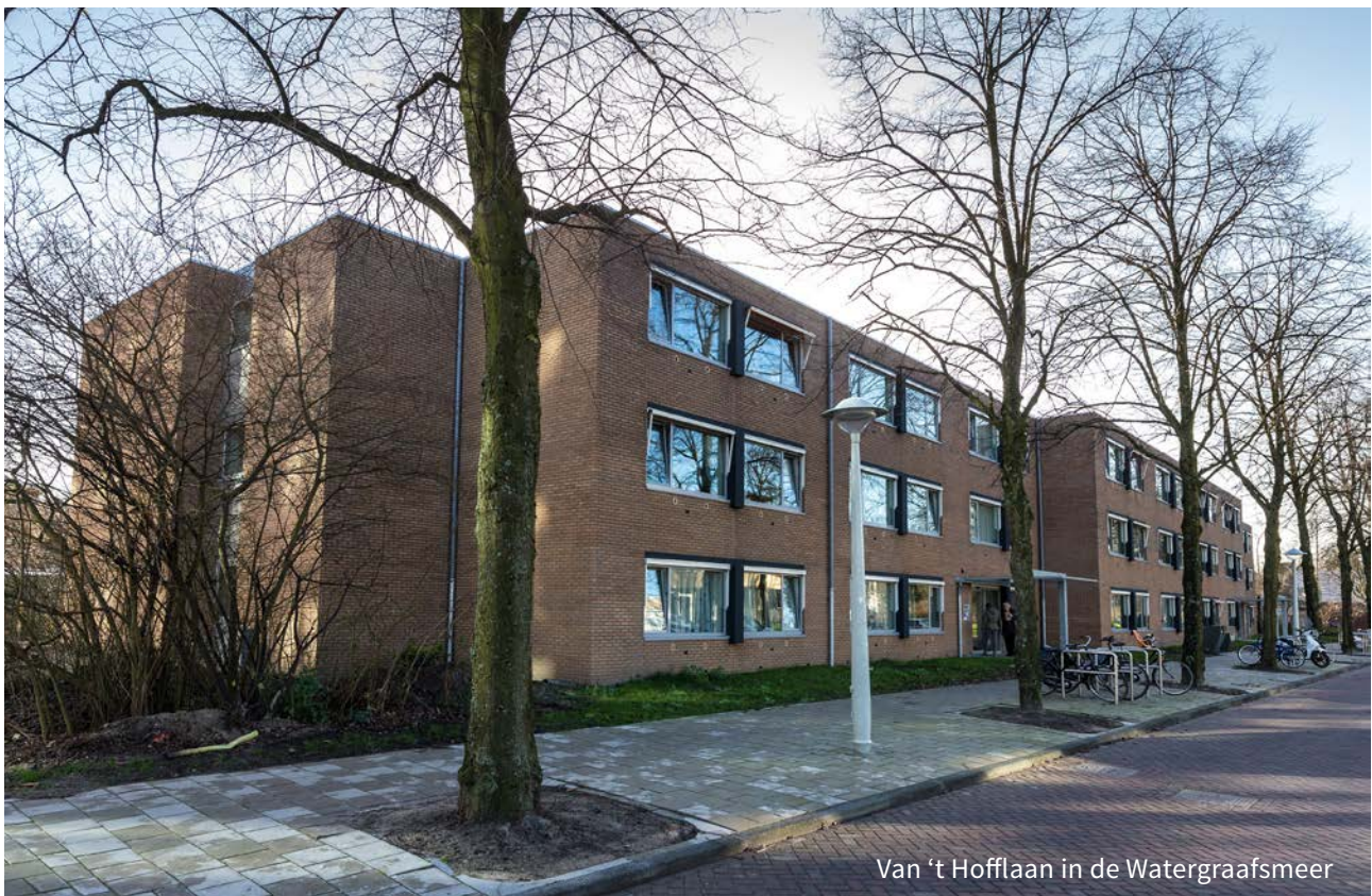
Van 't Hofflaan in de Watergraafsmeer

Dit boekje is bedoeld voor medewerkers. Toch delen we deze informatie graag met u, zodat iedereen weet wat er allemaal gaat gebeuren. Ook ziet u precies wie van onze medewerkers wat doet. Heeft u afspraken gemaakt om te helpen tijdens de verhuizing, bijvoorbeeld bij het in- en uitpakken? Lees dan vooral deze informatie goed door. Alvast hartelijk dank! Neem voor vragen gerust contact op met uw persoonlijk begeleider.