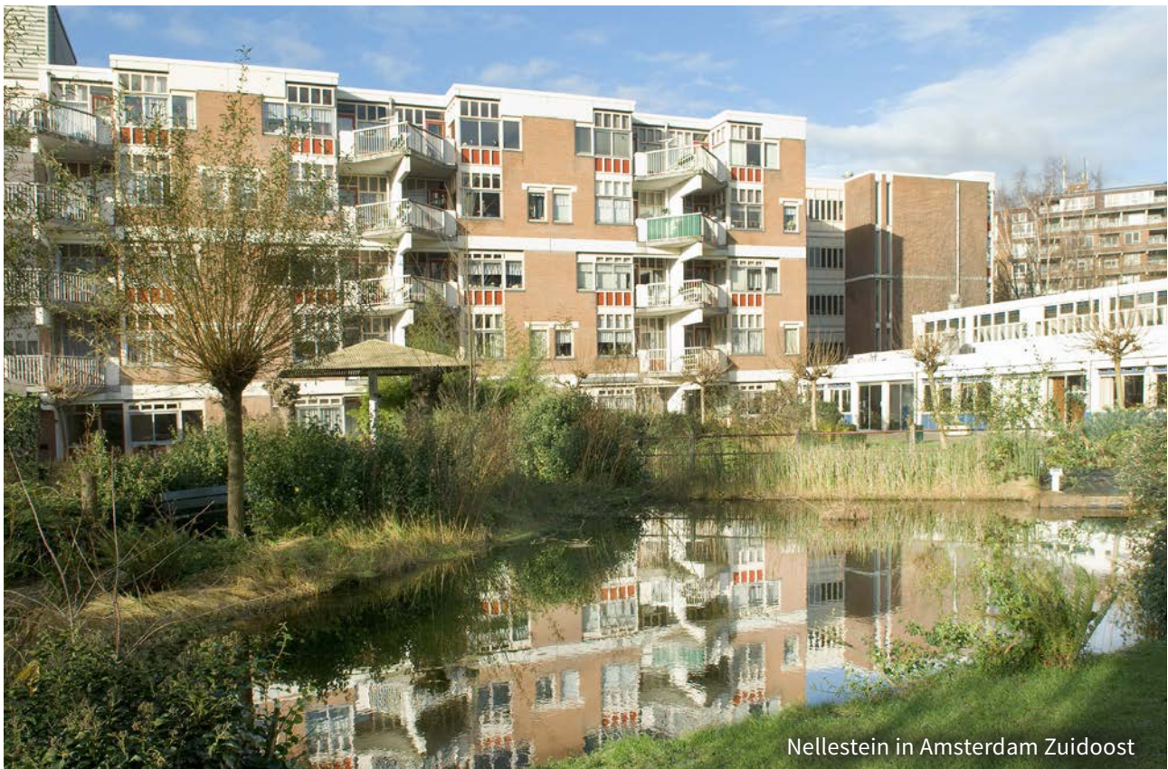
Nellestein in Amsterdam Zuidoost