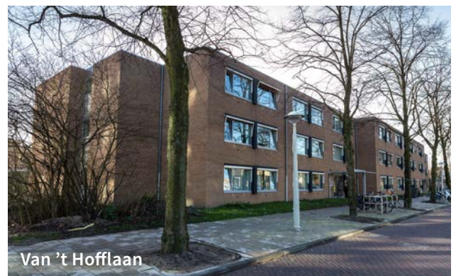
Van 't Hofflaan